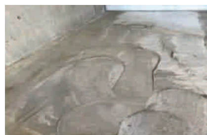
powierzchnia podczas szlifowania