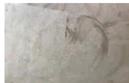
powierzchnia po szlifowaniu