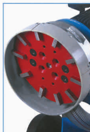
250 mm głowica szlifierska