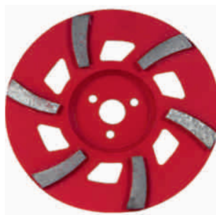
Tarcza do szlifowania betonu 180 mm Nr kat.: 3042180 Cena netto PLN: