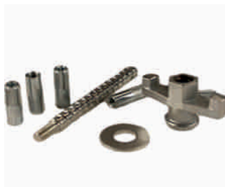
Zestaw kotwiący do statywu. Śruba, nakrętka, podkładka, 5 kotew z gwintem wewnętrznym. Cena netto PLN: