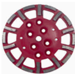
Tarcza szlifująca 250 mm do średnio twardych materiałów Nr kat.: 3034250 Cena netto PLN: