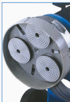
100 mm szlifujące krążki