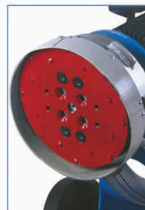
250 mm PCD głowica szlifierska