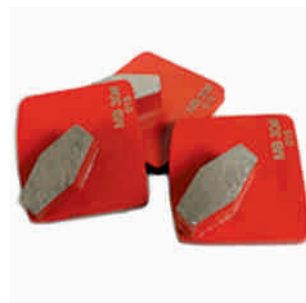
Segment Redi-Lock do szlifowania materiałów o średniej twardości Nr kat.: 304025M Cena netto PLN: