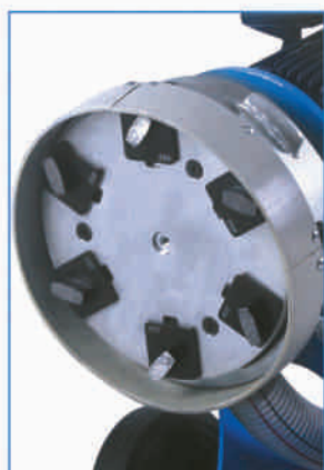
Redi-Lock segmenty szlifujące